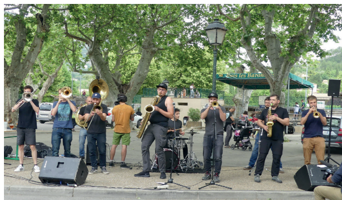
@ Crédit photo - Alain BOSMANS | Buissonnantes du 4/6/2021 & le groupe électro brass «LGMX».