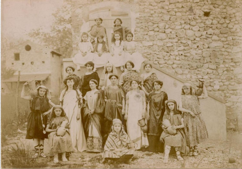
Pâques 1912 « Fabiola? »

Situé sur la place des Frères prêcheurs , le bâtiment est inauguré le 23 juillet 1911 , par l'évêque de Valence monseigneur CHESNELONG.